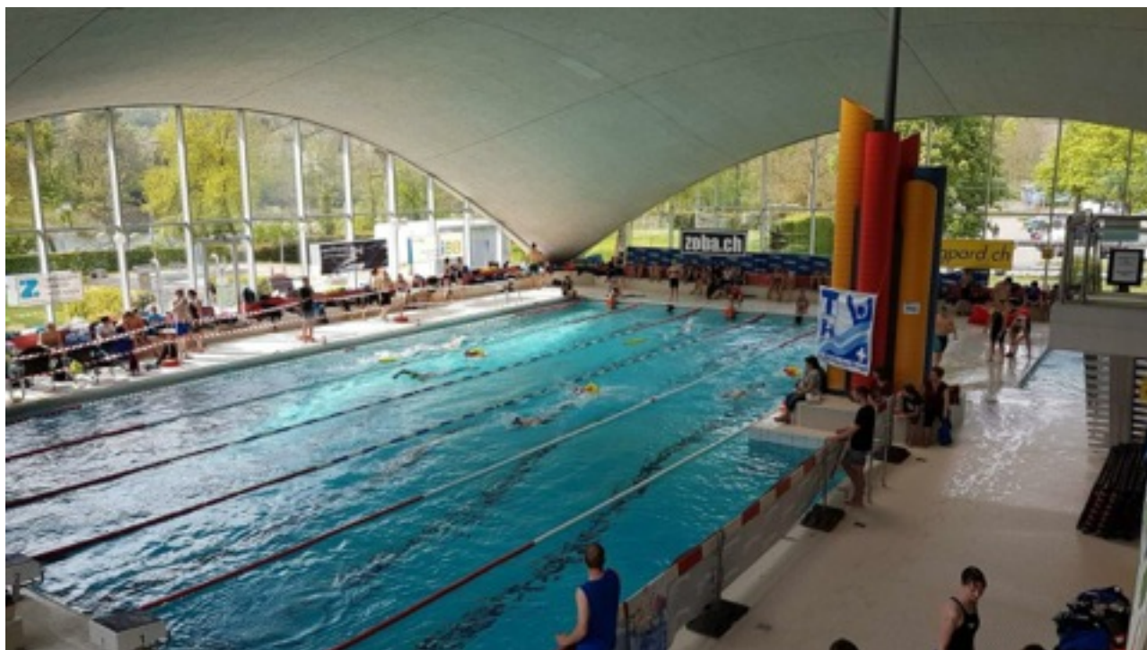
Bassin de 25m 5 couloirs

Nos masters étaient du côté de BRUGG en ce week-end du 4 et 5 novembre pour le championnat Suisse master 2023.