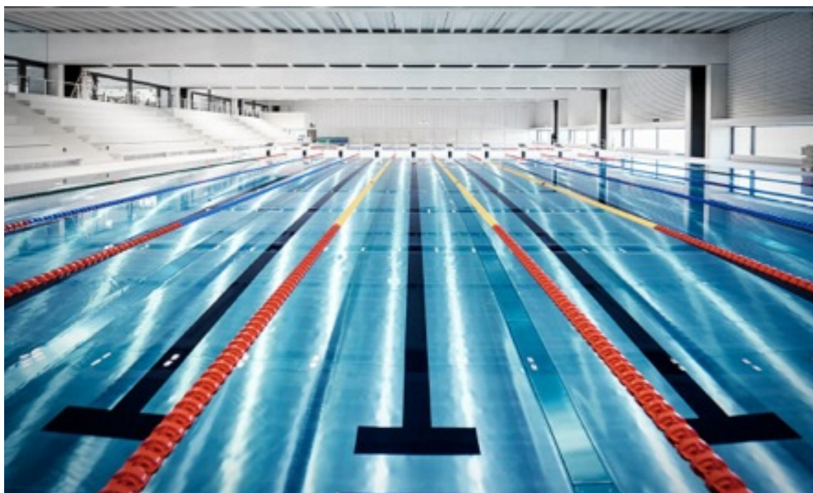
Magnifique bassin olympique du CAMPUS SURSEE

C'est dans un magnifique bassin de 50m de 10 couloirs, avec un bassin d'échauffement et de récupération à proximité, que l'ensemble des nageurs(es) des meilleurs clubs Suisse se sont donnés rendez-vous durant 4 jours. A noter que quelques délégations ont été invitées pour l'occasion, on retrouve l'Allemagne, les Pays-bas, la France, l'Autriche ou encore le Liechtenstein, une occasion de densifier et d'augmenter encore plus le niveau des épreuves.